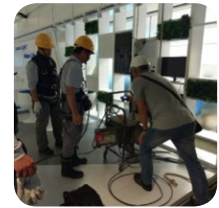
承攬商機械、設備檢查

針對非光寶員工之其他工作者，光寶亦遵守法令之規定，實施必要之管理，確保公司內之承攬商有安全與健康的職場環境。如將安全規範列入合約、承攬人員入廠前之危害告知宣導及安全督導等相關安全管理及訓練。並不定期實施安全檢查，將缺失提供予發包單位或承辦人實施安全改善。